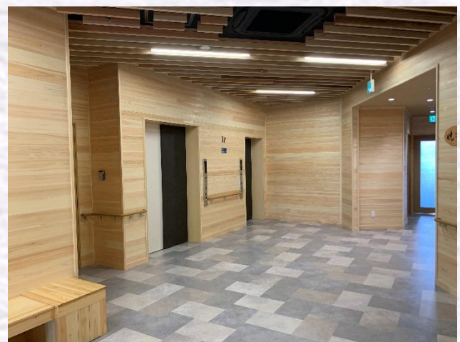
1F エレベーターホール