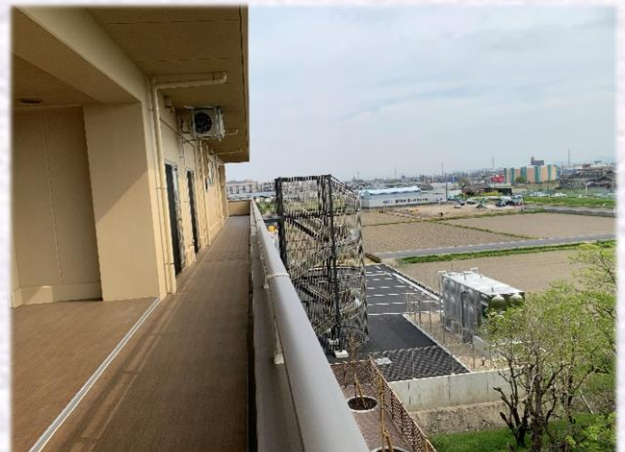
2F 避難通路・避難階段