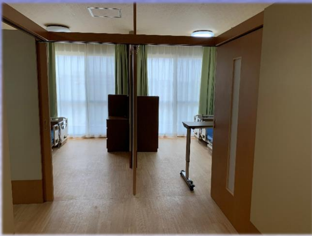
1F 多床室 (外側の部屋)