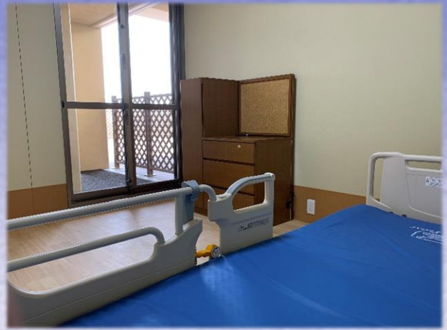
1F 多床室 (内側の部屋)