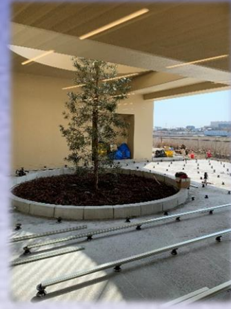
1F デッキテラスシンボルツリー