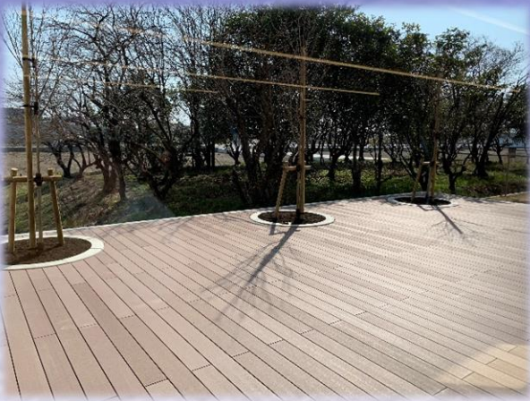
1F 多床室デッキテラス