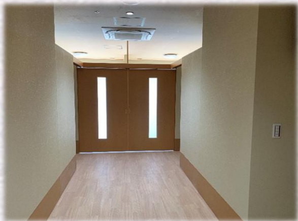
1F 多床室 入口