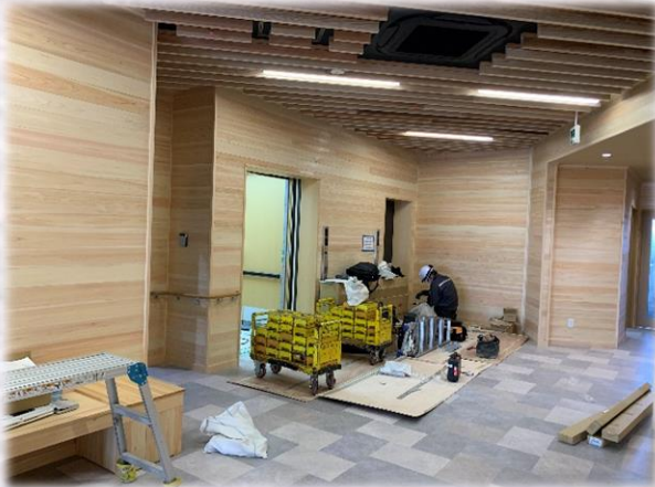
1F エレベーターホール