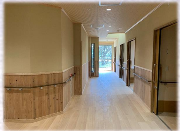
1F 多床室 廊下