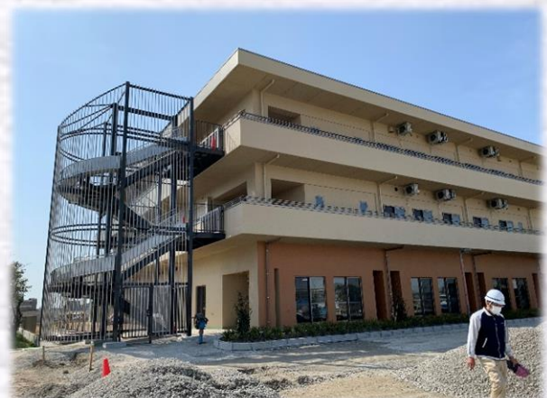
非常用階段及び滑り台