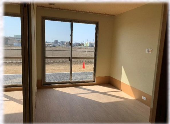
1F 多床室 (外側部屋)