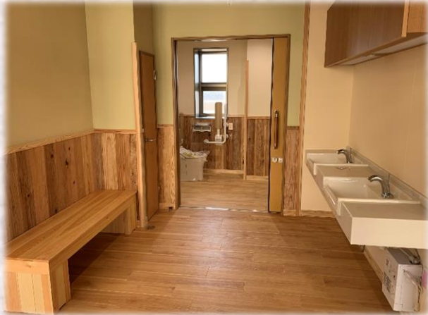
2F ユニット洗面・トイレ