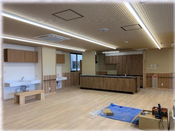
1F 多床室 食堂・機能訓練室