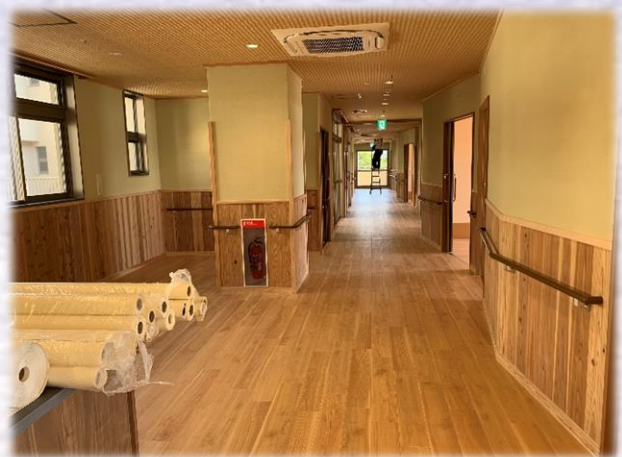
2F ユニット廊下・談話コーナー