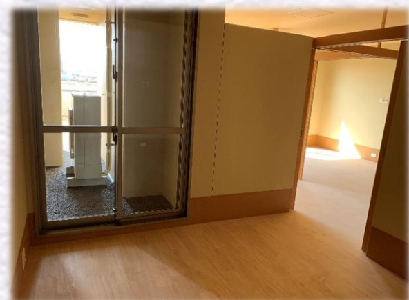
1F 多床室 (内側部屋)