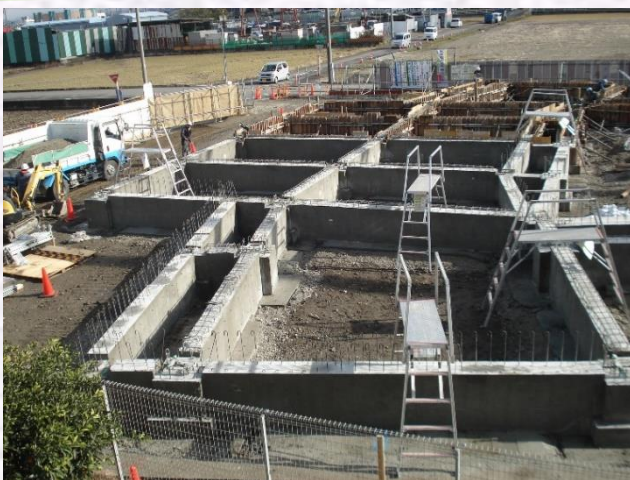
12.16 撮影（基礎工事完了）