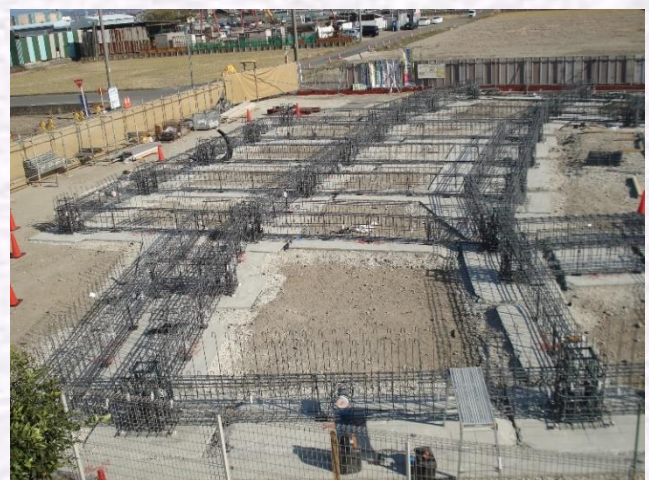
12.8 撮影（基礎配筋工事完了）