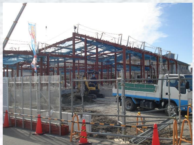
1.6 撮影（鉄骨建方完了）