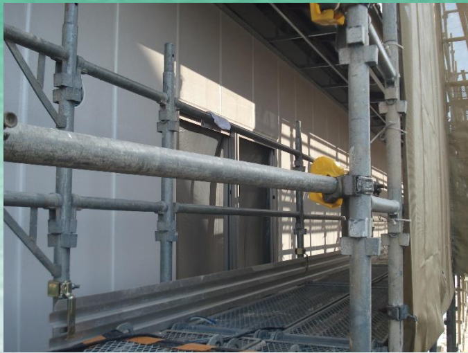
2.12 撮影 (サッシ工事完了)