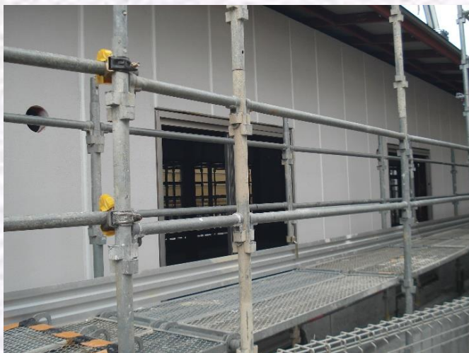
2.1 撮影 (屋根・外壁・サッシ工事風景)