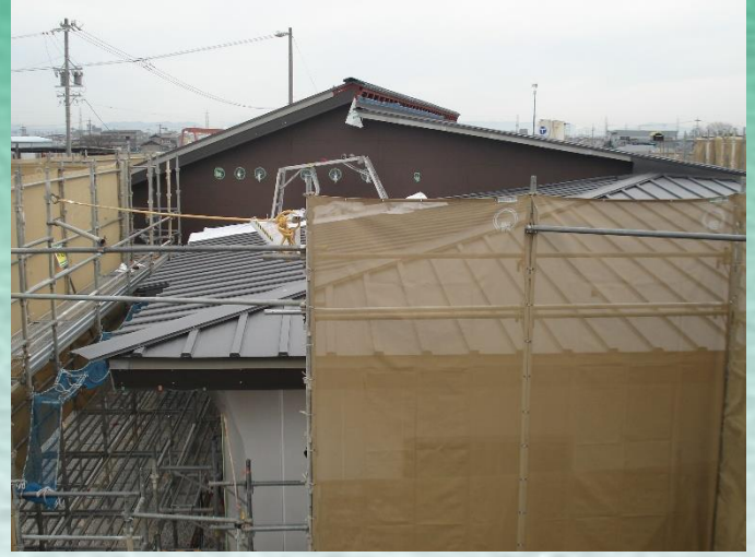
2.12 撮影 (屋根工事風景)