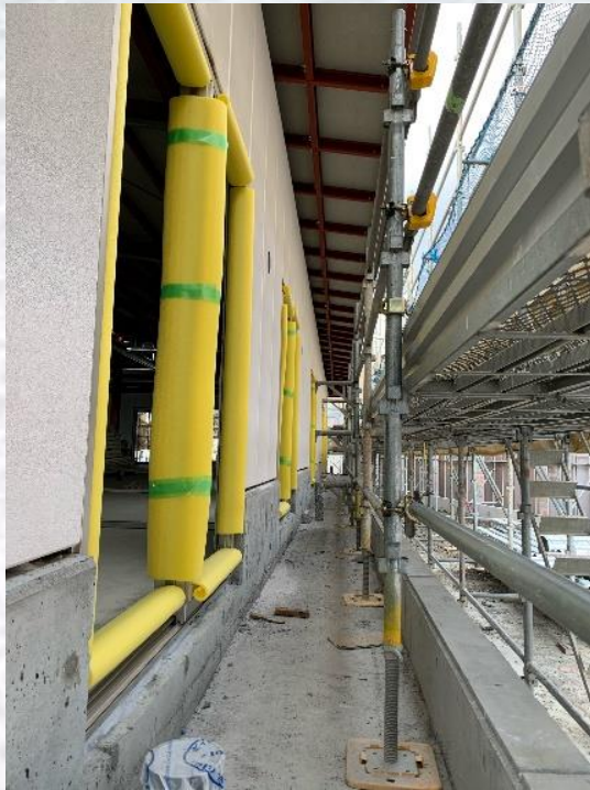
2.4 撮影 (サッシ枠工事風景)