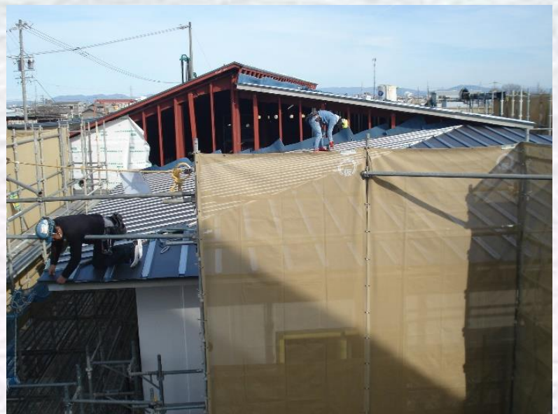
2.5 撮影 (屋根工事風景)