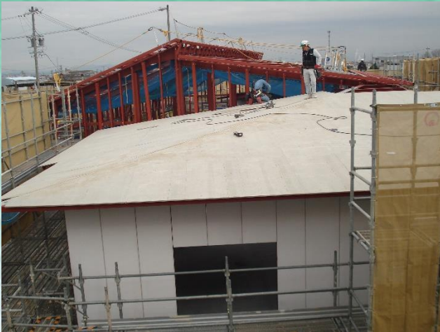
1.28 撮影（屋根・外壁工事風景）