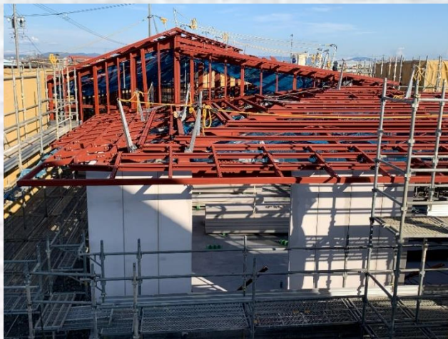
1.25 撮影（屋根・外壁工事始まる）