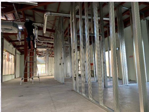
（建物内西側間仕切り工事風景）