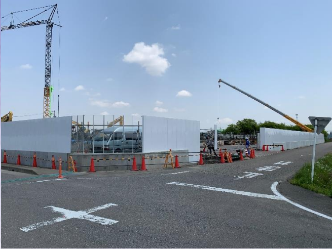
南側擁壁・仮囲い工事完了