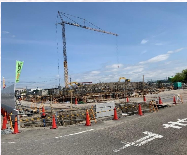
西側基礎配筋工事