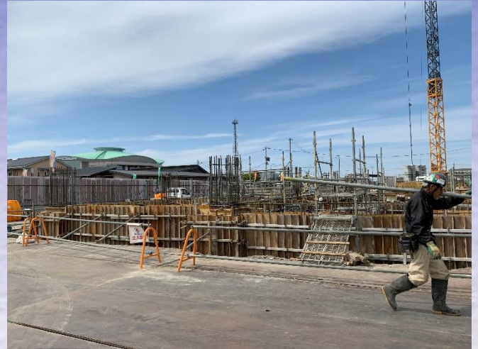
西側基礎配筋工事