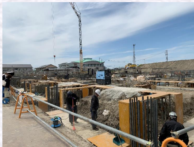
中央及び東側基礎工事