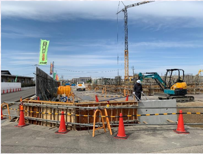
南西角側擁壁工事