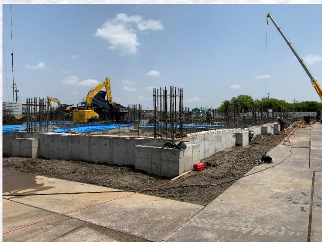
西側基礎工事完了