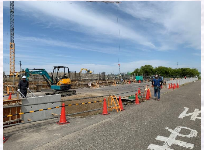
南側擁壁工事完了