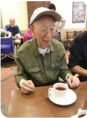
おでかけは楽しいですね