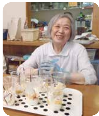
手作りおやつは 格別

おやつにパフェを作りました。「これから冷たくて美味しいものを作ります」とお伝えすると「私もやる! どうするの?」と腕まくり。冷たくて美味しいマイパフェの味は格別でした。