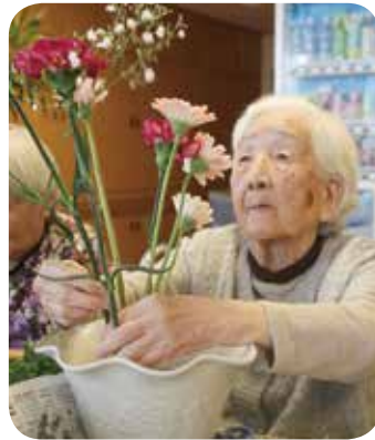
一輪に思いを込めて

参加される方は女性が多いこともあり、花を通じて会話がとてもはずみ、いつも和気あいあいとした雰囲気の中で行っています。