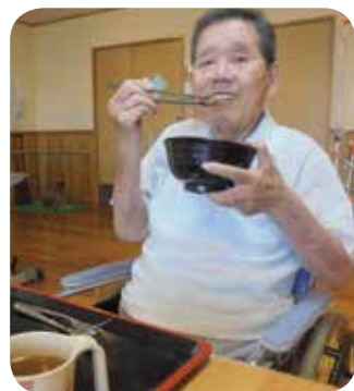
焼き立ての鰻丼を食べました！