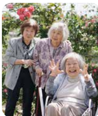
バラの香りにうっとり

外出行事は、利用者様の機能訓練の一環として、心身機能の充実等を目的に行っており、大人気の行事となっております。