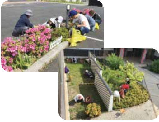
とてもあたたかいお心遣い

今後とも、多くの方々に支えていただける地元で根ざした施設として、利用者の皆さまの生活を支援します。