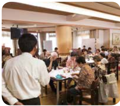
今回は「終活」について学びました。

最近では、福祉カフェで交流を重ねた参加者同士、また、職員ともなじみの関係ができてきました。認知症や施設について等、介護問題でお悩みの方！ぜひ一度「福祉カフェめだか」にお越しください。皆さまと同じ悩みを持つ仲間、そしてスタッフがお待ちしております。