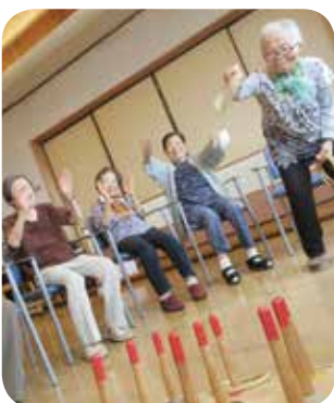
笑顔の輪ができています

ただいま輪投げが大流行。高得点を目指して、楽しんでいらっしやいます。輪投げで疲れた後は、皆でテーブルを囲んでコーヒータイム。午後の集會室は、利用者様の歓声があふれる憩いの場となっています。