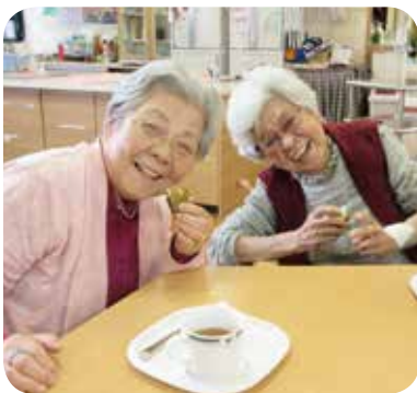
喜びがあふれています

利用者の皆さまに好評な「おやつバイキング」を行いました。「おやつが何種類もあって、選ぶ楽しみがあった嬉しい」と、喜んでいただけました。管理栄養士の手作りメニューも楽しみのひとつになっており、今回のメニューは「焼きプリン」。初めて口にされる利用者様もおられ、その感動を利用者様同士で話している姿が、とても印象的でした。