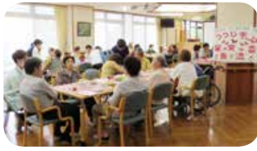
感動につつまれた 家族交流会

普段の様子を、写真やイラストにして上映したスライドショーはたいへん好評で、涙ぐまれる方や、映像を写真に収める方もいらっしやいました。これからも、利用者の皆さまの介護を安心して任せていただけるよう、思いやりのある関わりを大切にしたいと思えます。