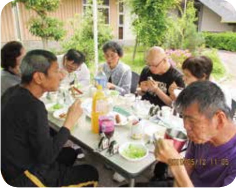
皆でバーベキュー

当日は、ちよと母の日でしたので、利用者の皆さまからお母さん方に日頃の感謝の気持ちを込めて、カーネーションをプレゼントしました。