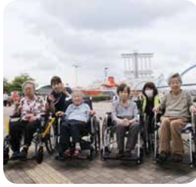
ひさびさの外出で、少し緊張した面持ち

水族館では「あの魚をお寿司にする」と美味しいかな」と話が弾み、大須観音では昔訪れた時と街並みが変わっており、当手を懐かしんでおられました。次回もまた一緒に行きましようね。