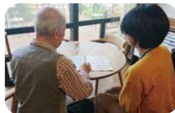
サービスのご説明