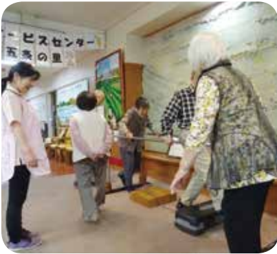
仲良しさんが集まり、一緒に楽しく運動

普段は気が進まない方も、仲良くなった方々と一緒なら「やってみよう」という気持ちになり、楽しく体を動かされています。