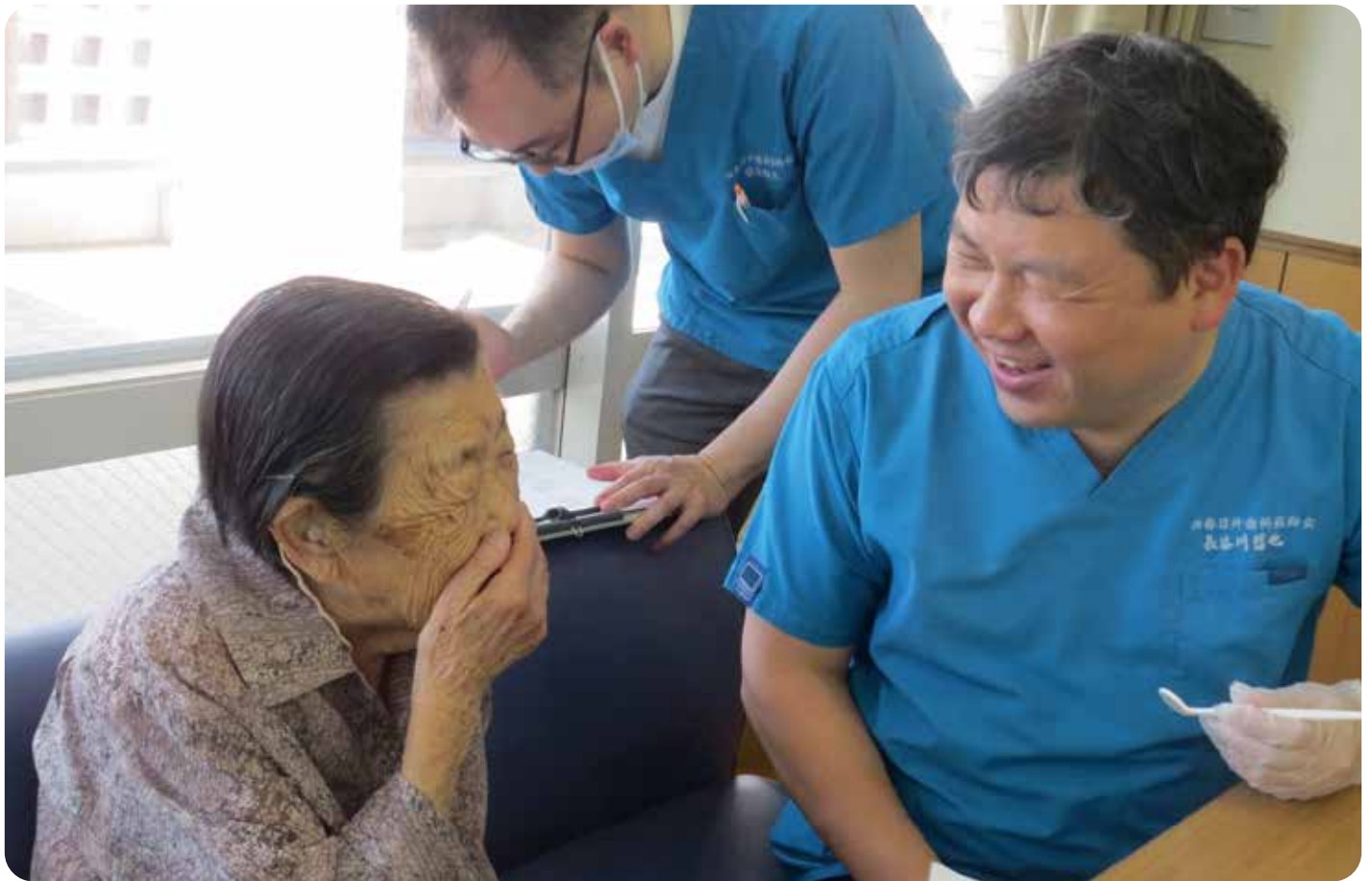
令和元年6月6日 利用者様の歯科健診