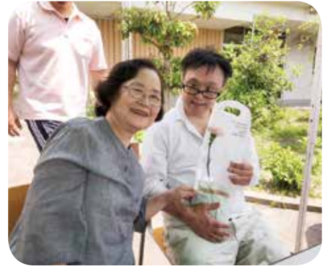
カーネーションのプレゼント、想いを込めて