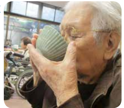
今日は、心待ちにしていた茶道の日

「抹茶は久しぶりだわ」と笑顔で話されながら、音を立てて、美味しそうに召し上がっておられました。