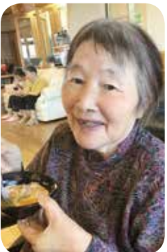
おいしくできあがり

旬の食材を使い、おやつ作りを行っています。利用者様と職員が楽しく話しながら協力し合い、美味しいおやつができあがりました。