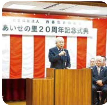
施設が開設して20年 感謝の思いをこめて

ボランティアや地域の皆さまをはじめ、あいせの里にかかわる全ての方々に支えられ、施設が開設してから無事20周年を迎えられました。これからもこの地域を愛し、また、愛される施設として邁進してまいります。