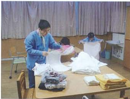
《洗濯》 そうじ・洗濯も、自分でできる事は自分で行ないます。