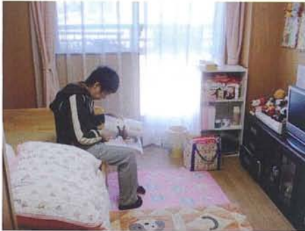
《居室》 ひとりの時間をゆっくり過ごせる自分だけの空間です。

10人1グループで生活する全個室ユニット型です。一つのユニットには玄関・リビング・ダイニングキッチン・トイレ・風呂等があり、少し大きめの10LDK一戸建ての雰囲気です。