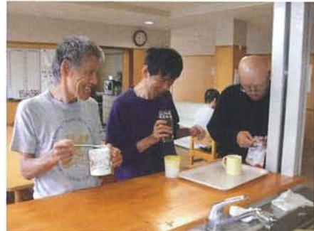
《キッチン》 飲み物やおやつを作ったり、休日は調理も行います。