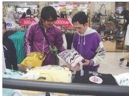
《余暇》 週末には買い物や喫茶、行楽などの外出もしています。